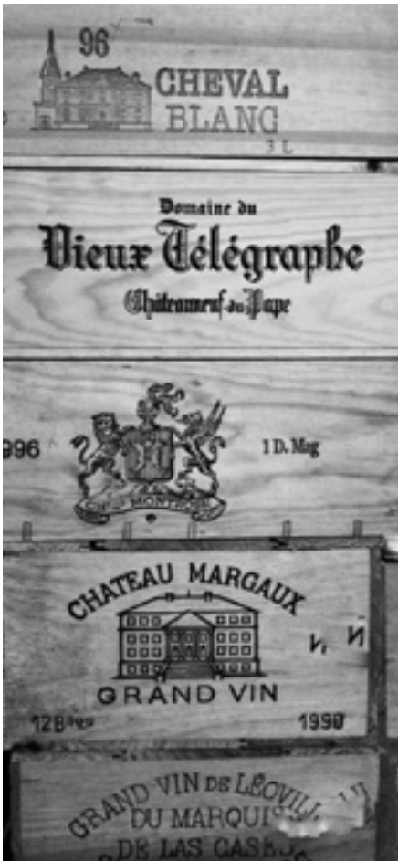
Lot 5, 27, 31, 46, 54