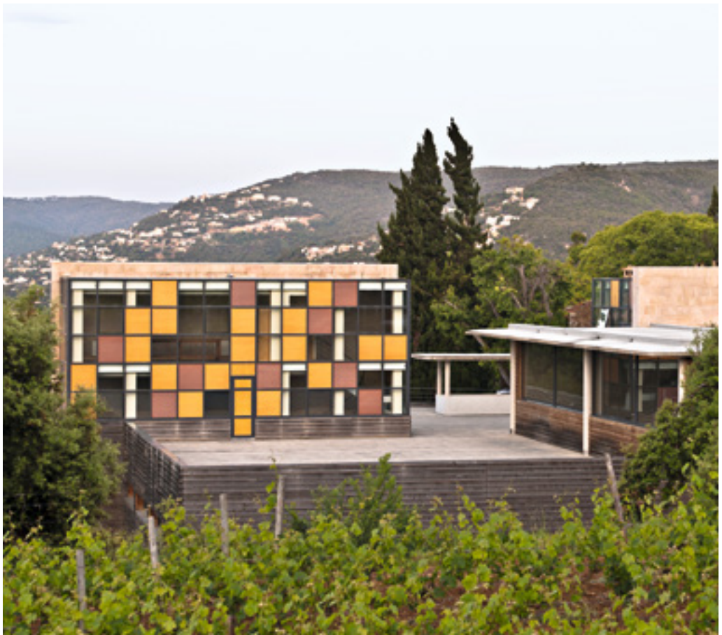
Bodega Clos d'Agon, Calonge, Costa Brava/ Spanien (DO Catalunya)