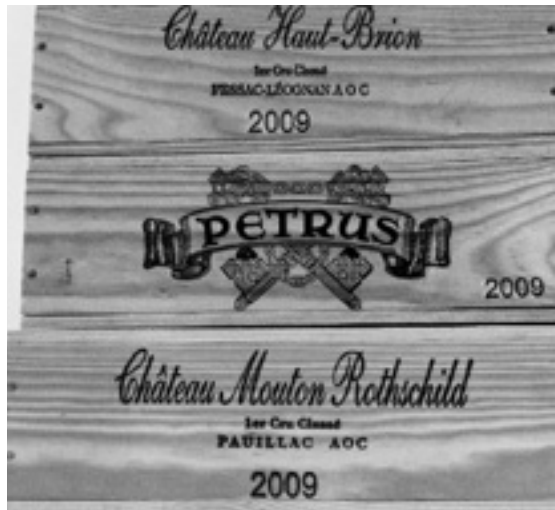
Lot 10-11, 37-39, 24-26