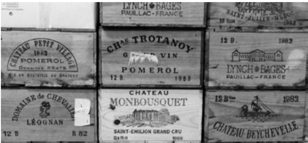
Lot 497, 498, 505, 515, 523, 524, 525