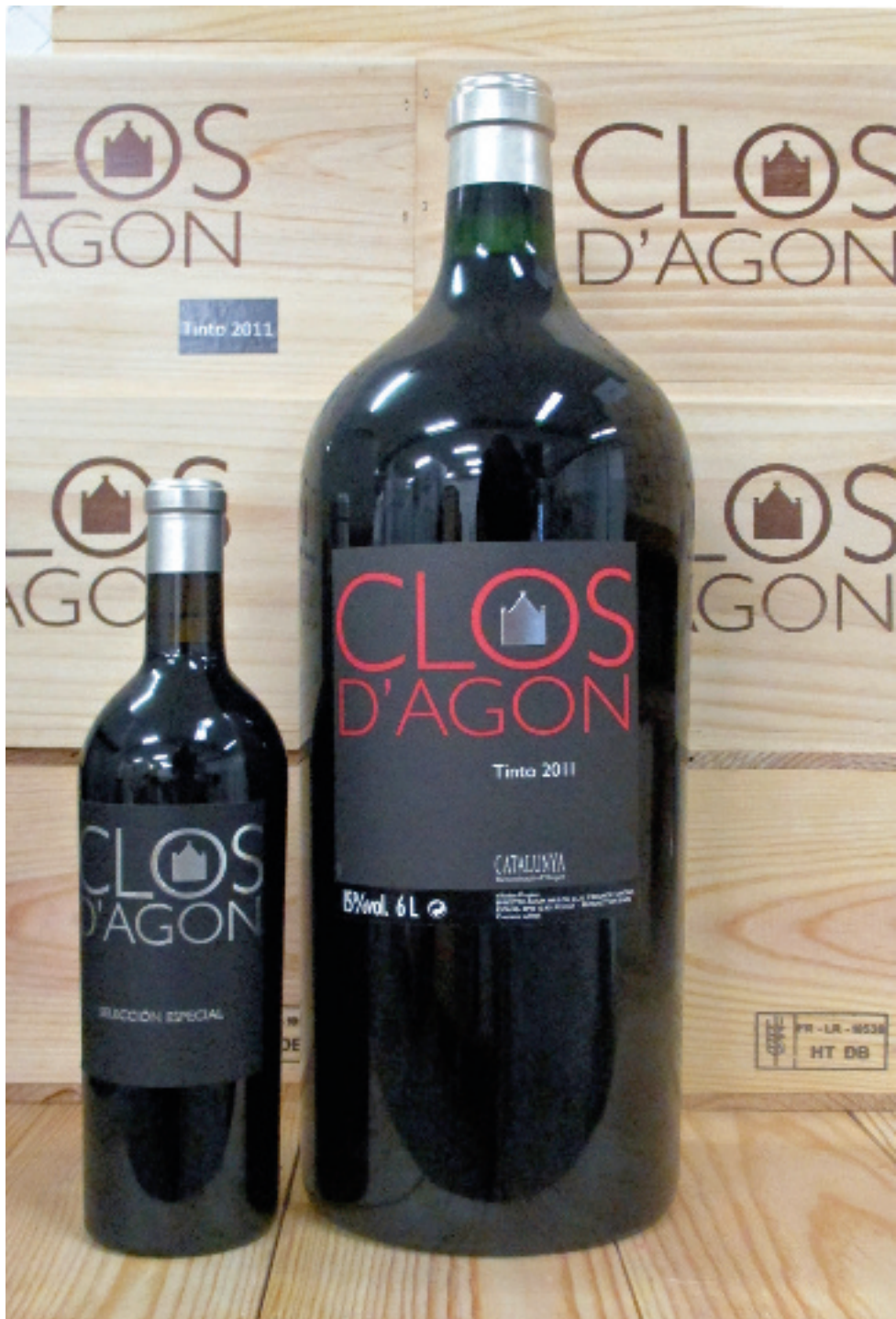
Clos d'Agon Selección Especial 2012 und Clos d'Agon Impérialflasche 2011